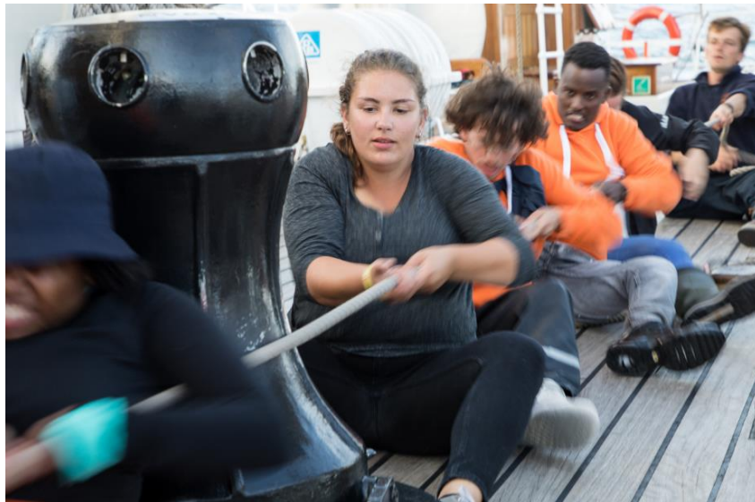
Alle zeilen worden gehesen.

Het avondeten wordt een uur naar voren geschoven zodat om 18:00 All Hands On Deck paraat staan voor de start. Het is een spectaculair gezicht dat gemanoeuvreeer om de beste startpositie te bemachtigen.